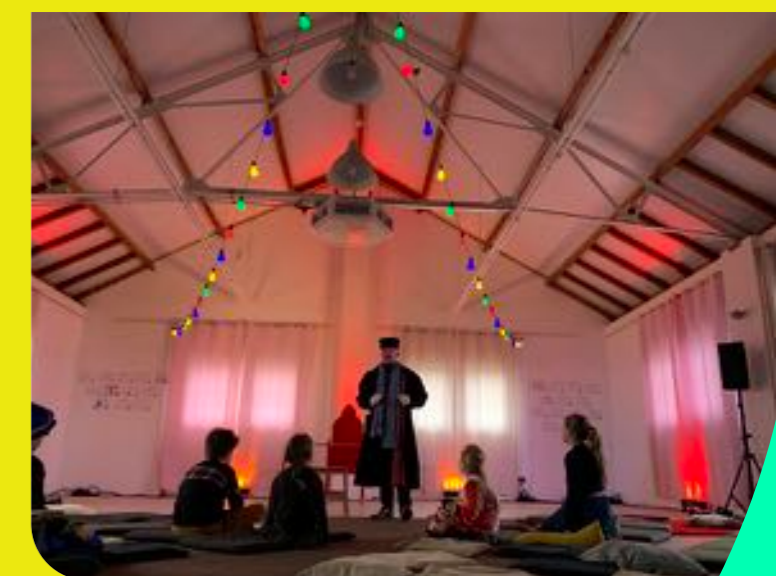
DE BROER VAN SINTERKLAAS.